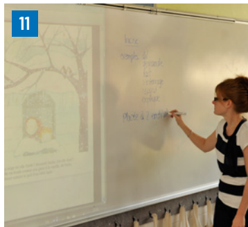
11. Au 2 e cycle du primaire, le dialogue et l'incise à partir de l'album Stella reine des neiges .