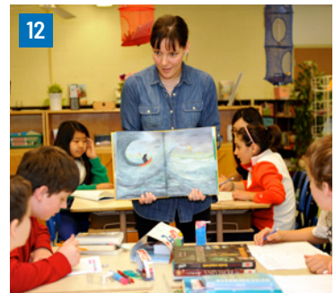
12. Au 3 e cycle du primaire, la phrase P et ses expansions à partir de l'album Le parapluie .