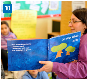
10. Au 1 er cycle du primaire, la phrase négative à partir de l'album Les Deux arbres .